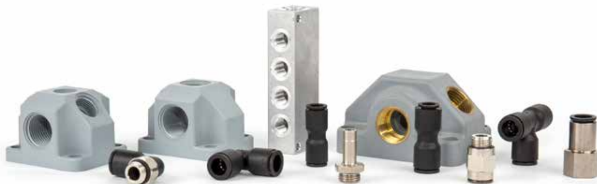
Rohr AD 1